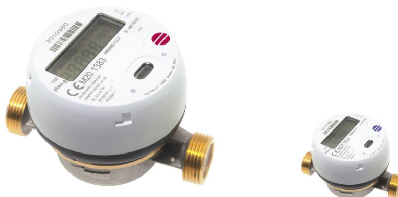
Varmvatten- och kallvattenmätare HYDRODIGIT med WM-buskommunikation