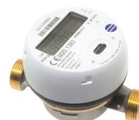
Varmvatten- och kallvattenmätare HYDRODIGIT med WM-buskommunikation